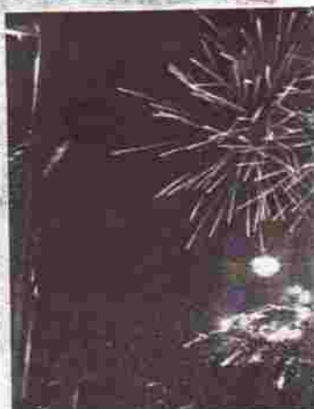
La CCN organise une célébration du minuit, qui sera précédé – à 18 h 57 – par le premier feu d'artifice qui sera bien